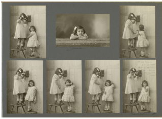
L'appel au père Noël / L'ange (au centre), décembre 1910 CIG Y631 12 41