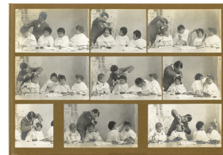
« Chez le coiffeur », 8 mars 1900, CIG Y631 04 59 et 60