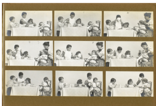
Scène de goûter autour d'un produit Nestlé, entre 1896 et 1898 CIG Y631 03 24