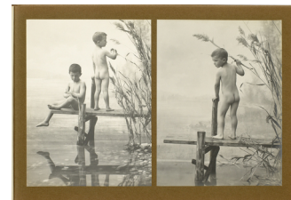
« Dans les roseaux », 1896 CIG Y631 04 52 à 57