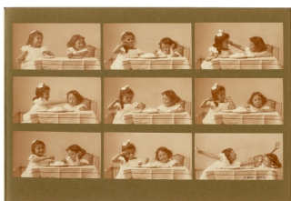
Photographier le mouvement : la bataille de purée, 7 mai 1902 CIG Y631 05 39