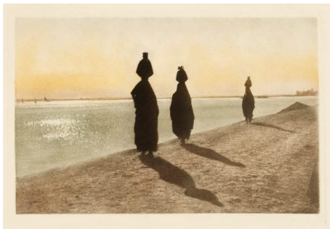
Fred Boissonnas (1858 -1946), Egypte. Les porteuses de cruches, 1929, cuvette: 217 x 326 mm; feuille: 331 x 486.5 mm; image: 201 x 312 mm, Inv. FBB P GF11 ssnum

(téléchargeable : www.ville-ge.ch/bge/presse/2013_boissonnas/Boissonnas_images_presse.pdf )