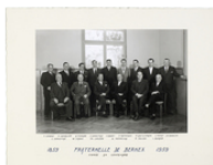
Bernex, la Fraternelle, 3e quart 20e s.; 1959