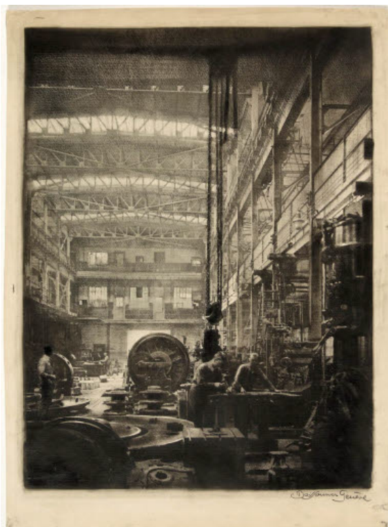
La halle d'usinage des machines tournantes des Ateliers de Sécheron à Genève, épreuve au charbon d'une prise de vue antérieure à 1918, vers 1920-1930, feuille: 515 x 378 mm; image: 454 x 344 mm, Inv. FBB P GF11 ssnum