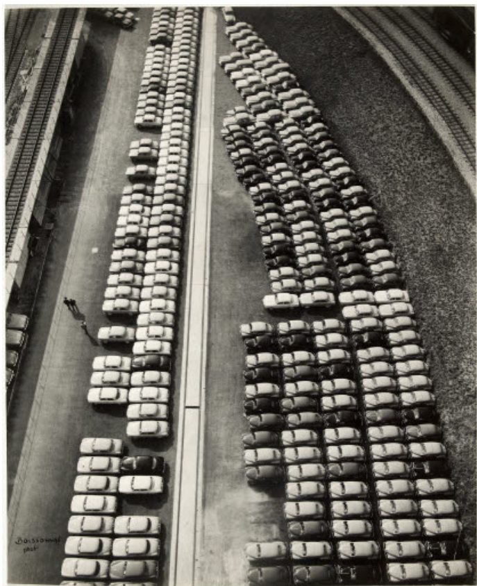
Atelier Boissonnas, Automobiles (gare de la Praille ?) , v. 1950, image: 580 x 473 mm, Inv. FBB P TGF ssnum, Mention obligatoire : BGE, Centre d'iconographie genevoise